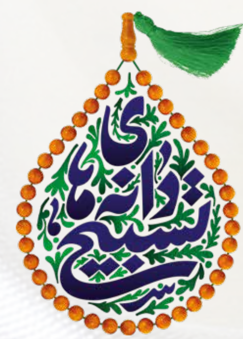
مجموعه نمایشگاهی دانه‌های تسبیح ویژه روز ملی تجلیل از امامزادگان

فضای مجازی پر است از مطالب راست و دروغ! گاهی از روی غفلت، ما هم می‌شویم ابزار دست دروغ‌گویان و هرچه به دستان می‌رسد منتشر می‌کنیم و برای این و آن ارسال. مثل ماجرای آن کارگردان معروف سینما که گفتند برای ساخت فیلمش امامزاده‌ای ساخته و بعد اوقاف آمده گفته این امامزاده‌ای معتبر است!!! و البته دروغ بود! خودش هم مصاحبه کرد و گفت: «هیچ امامزاده‌ای برای هیچ‌کدام از فیلم‌هایش نساخته و دشمنان از اسمش سوء استفاده کرده‌اند.» اما چه فایده... عده‌ای هنوز در حال نشر این دروغ هستند. بدون اطلاع... بدون دقت!