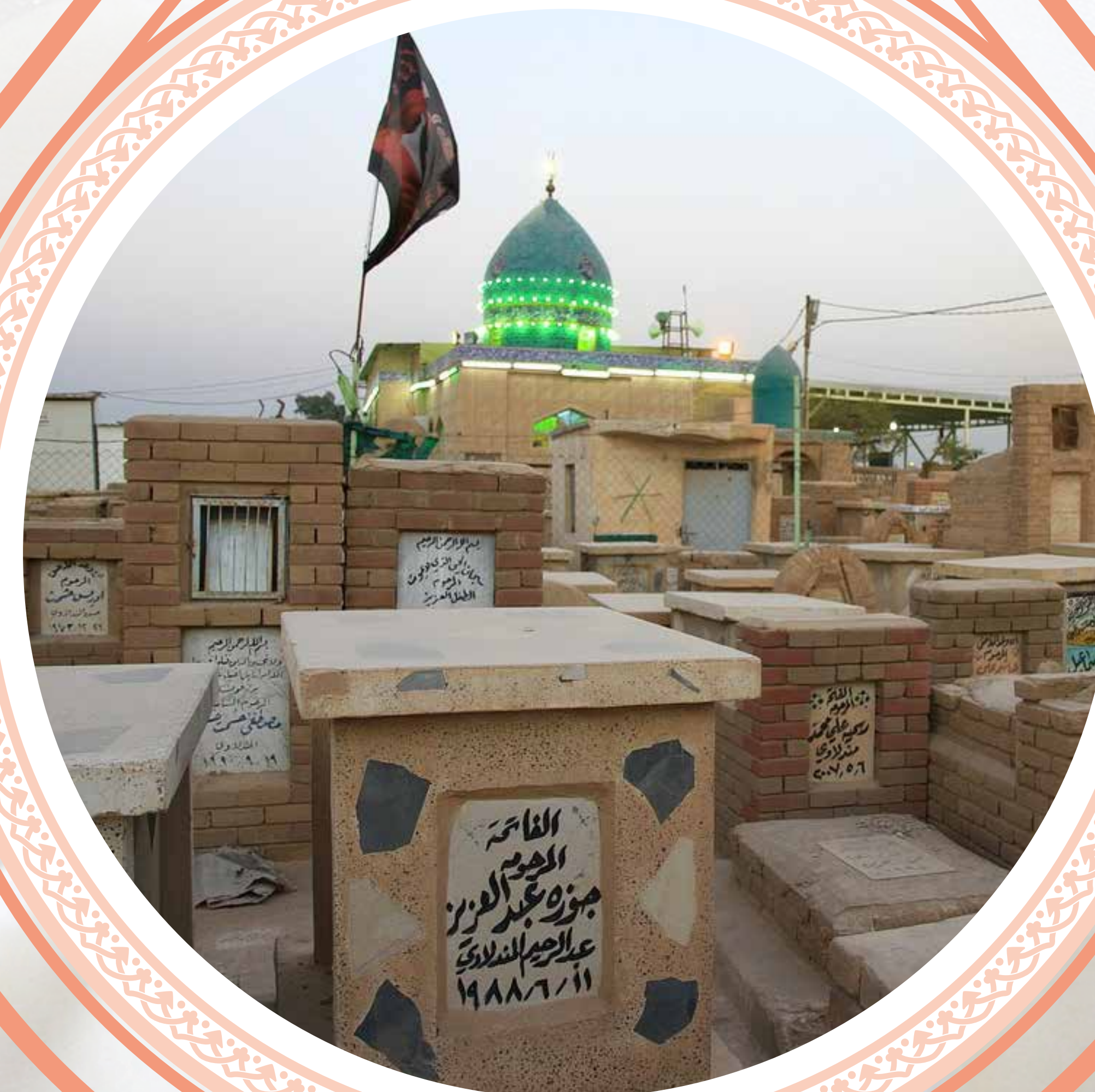
عکس: قبرستان وادی السلام - نجف

وجود امامزادگان فقط مختص به ایران نیست. عده‌ای به دروغ این را مطرح می‌کنند تا با اعتقادات ما بازی کنند! در عربستان، عراق، سوریه و بسیاری از کشورهای دیگر نیز امامزاده وجود دارد، تنها تفاوت در این است که در برخی حکومت‌ها اهمیت به فرزندان رسول خدا ﷺ داده نمی‌شود که هیچ! دشمنی هم می‌کنند، برای همین قبور آن‌ها ناشناخته و گمنام است.