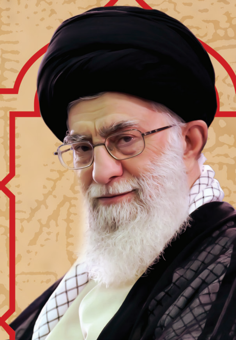
مدظله العالی مقام معظم رهبری

زندگی حسین بن علی علیه السلام در طول تاریخ زندگی پنجاه و چند ساله ای آن بزرگوار، همه درس است.