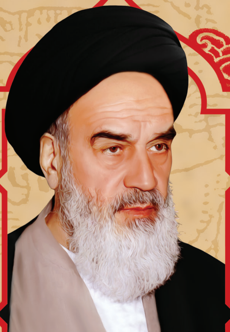
رحمت الله عليه حضرت امام خمینی

نام مبارك حضرت سیدالشهداء علیه السلام را زنده نگه دارید، که در این صورت اسلام زنده نگه داشته می شود.